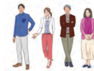
カジュアル 男性・女性とも 普段通りの服装 ポロシャツ・パンツなど

日中は普通の旅行と同様、リラックスできる服装がおすすめです。夕方17:00頃から就寝にかけては、ドレスコードと呼ばれる服装の規定があります。大きく分けてカジュアル、インフォーマル(セミフォーマル)、フォーマルの3タイプ。その夜にふさわしいドレスコードは、船内新聞にてご案内していますので、そちらをご覧ください。 ※本クルーズではフォーマル・インフォーマルはございません。