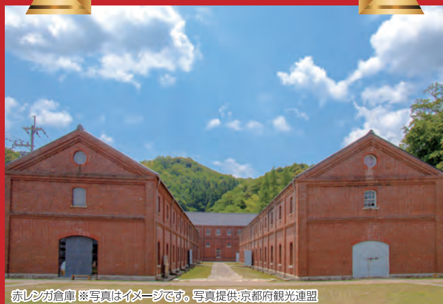
赤レンガ倉庫 ※写真はイメージです。